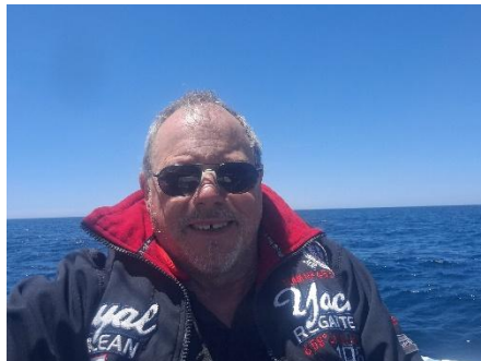
Helmut Schmidt / Euer Skipper