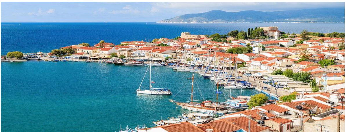
Wie hier auf der Insel Samos liegt man fast überall im Revier sehr charmant direkt an der Hafenspromeade.

In der Regel laufen wir abends kleine Fischerhäfen an oder ankern nach Lust und Laune in traumhaften Buchten. Die Route wird vom Skipper geplant und mit der Crew vor dem Auslaufen besprochen. Dabei werden Wünsche der Crew in Abstimmung berücksichtigt, wenn es Wind und Wetter zulassen. Der Törn findet auf einer modernen Segelyacht statt, die von allen Crew-Mitgliedern abwechselnd gesegelt wird. Jedes Crewmitglied packt mit an und erhält eigene Aufgaben. Segelerfahrung ist nicht erforderlich, da der Skipper die Grundkenntnisse des Segelns auf Wunsch vermittelt. Ebenso erhält jeder Teilnehmer auf Wunsch eine Meilenbestätigung nach dem Törn.