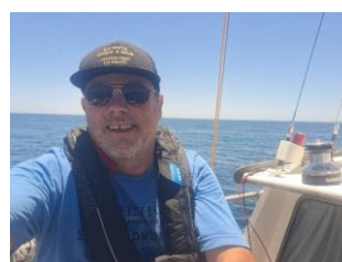
Helmut Schmidt / Euer Skipper