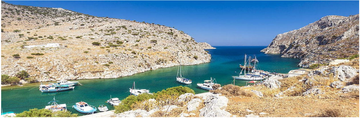
Großartige Ankerstopps wie hier in der Bucht Ormos Vathy auf Kalymnos gehören mit zum Erlebnis Dodekanes.